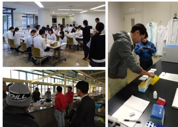
図4. 貝毒分析研修会（左上）ならびに漁協（左下）および試験研究機関での講習会（右）による普及