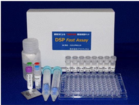
図1. 令和2年4月から市販を開始した下痢性貝毒簡易分析キット