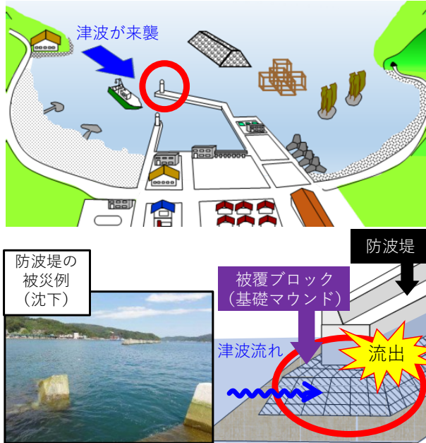
図1. 漁港、防波堤や被覆ブロック被災の様式図と風景